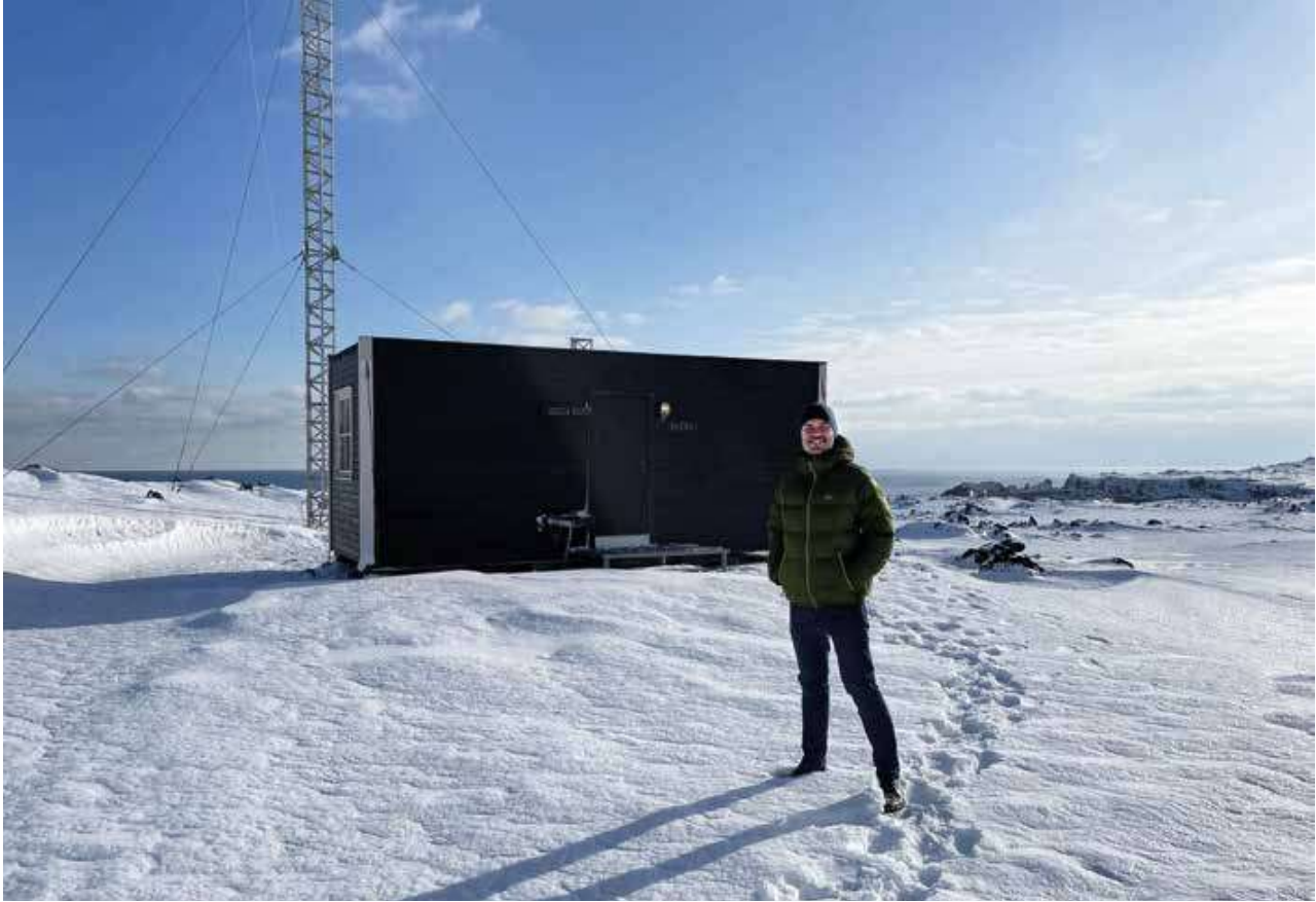
Tikkebu dagen jeg ankom.