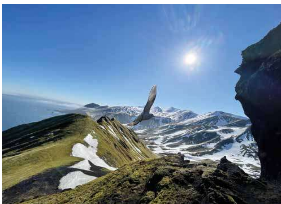
Schiertzegga mot Kapp Wien.