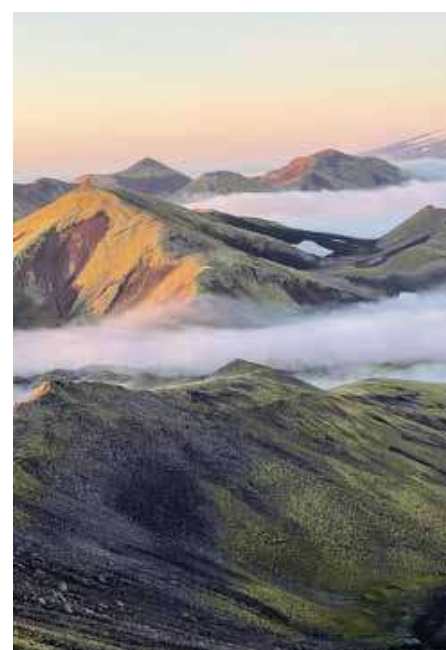
Tåke med Beerenberg.

Livet på øyen er nok noe annerledes enn beskrevet i forrige utgave av Amatørradio . Spesielt at det nå er tilgang til internett der oppe via satellitt. Noe særlig båndbredde var det ikke å snakke om, men noen få megabit fordelt på 19 personer fungerte faktisk bra nok for å få med seg det som skjedde hjemme. Telefon er det på hver lugar, og for en radioamatør så har man også Tikkebu tilgjengelig!