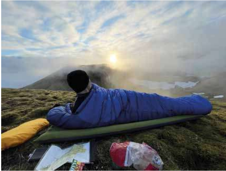
Midnattsol på Sør-Jan.