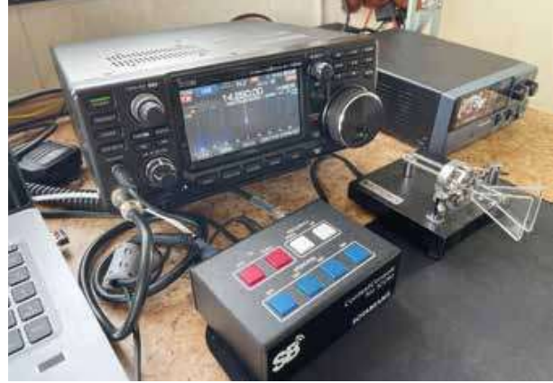
SSB fra Tikkebu.