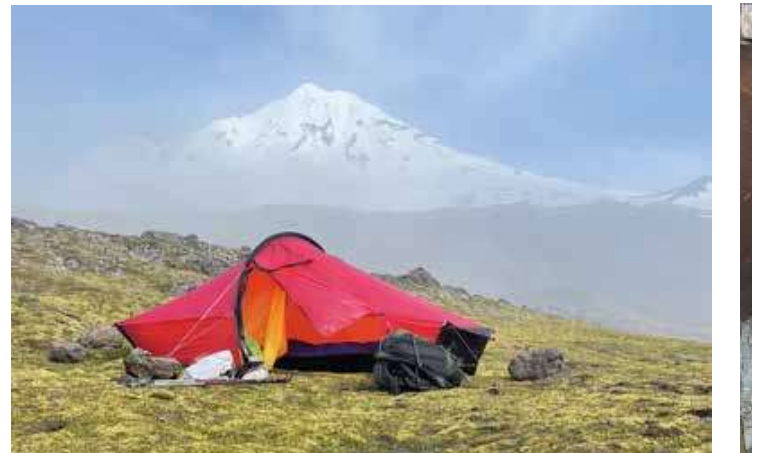
På vei til Vakta. Beerenberg bak.

var første gang jeg var på dette båndet. Jeg kan skjønne hvorfor 6 meter kalles «The Magic Band».