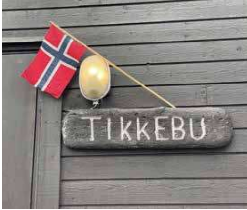
17. mai i Tikkebu.