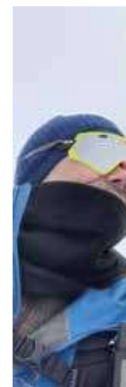
Jeg og Kuling.